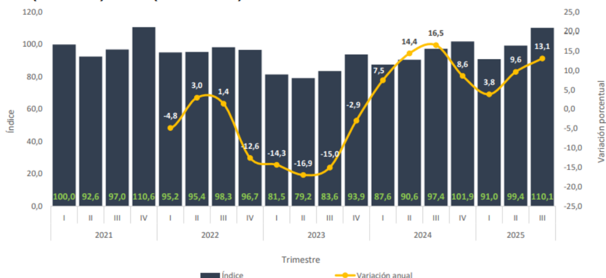
Gráfico 2. Índice y variación anual de la producción de obras civiles (precios constantes) Total nacional - serie a precios constantes 2021 (I trimestre) – 2025 (III trimestre Pr )

Durante el tercer trimestre de 2025, la producción de obras civiles a precios constantes registró un crecimiento de 13,1%, frente al mismo trimestre de 2024