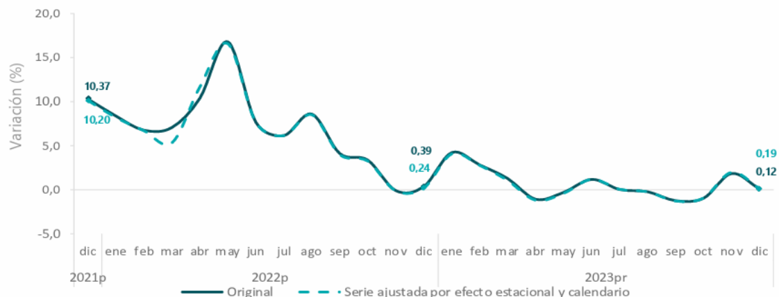
Gráfico 1. Tasa de crecimiento anual del índice del Indicador de Seguimiento a la Economía (ISE) Serie original y serie ajustada por efecto estacional y calendario 2021 P - 2023 Pr (diciembre)

Fuente: DANE, ISE P preliminar P provisional