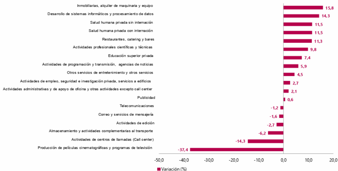
Gráfico 1. Variación anual de los ingresos nominales, según subsector de servicios Total nacional Diciembre 2023 P / diciembre 2022

En el año móvil hasta diciembre de 2023, diecisiete de los dieciocho subsectores de servicios presentaron variación positiva en los ingresos, trece presentaron incremento en el personal ocupado total y todos los subsectores presentaron variación positiva en los salarios, en comparación con el mismo periodo comprendido hasta diciembre de 2022. En diciembre de 2023, diecisiete de los dieciocho subsectores de servicios presentaron variación positiva en los ingresos, nueve presentaron incremento en el personal ocupado total y todos los subsectores presentaron variación positiva en los salarios, en comparación con diciembre de 2019.