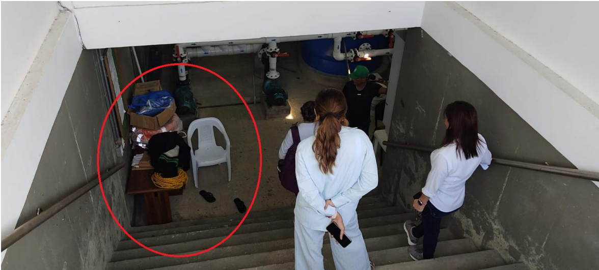
Cuarto de máquinas donde el trabajador se instala.