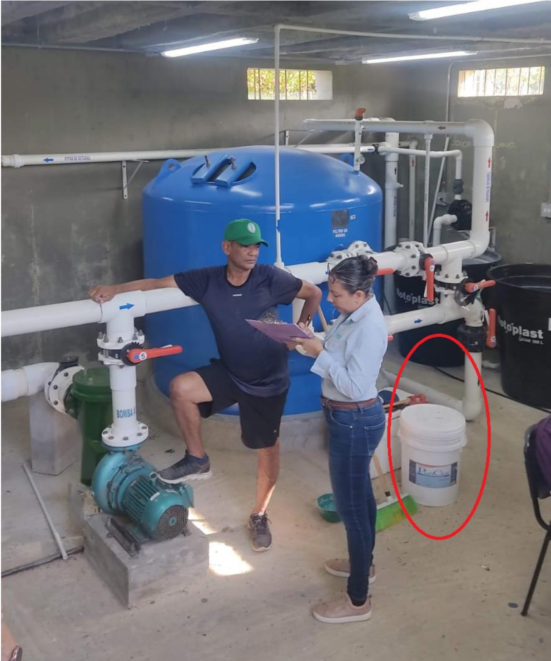
Sustancias químicas sin almacenamiento adecuado (hipoclorito)

Unicórdoba, calidad, innovación e inclusión para la transformación del territorio.