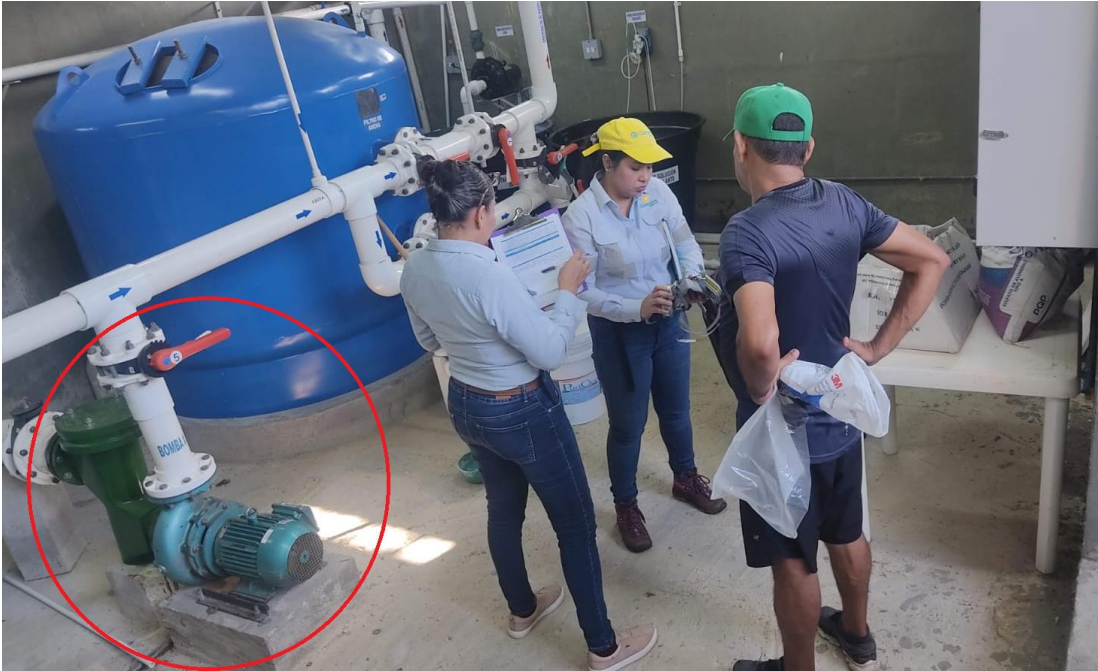
Maquinas que generan ruido.

Unicórdoba, calidad, innovación e inclusión para la transformación del territorio.