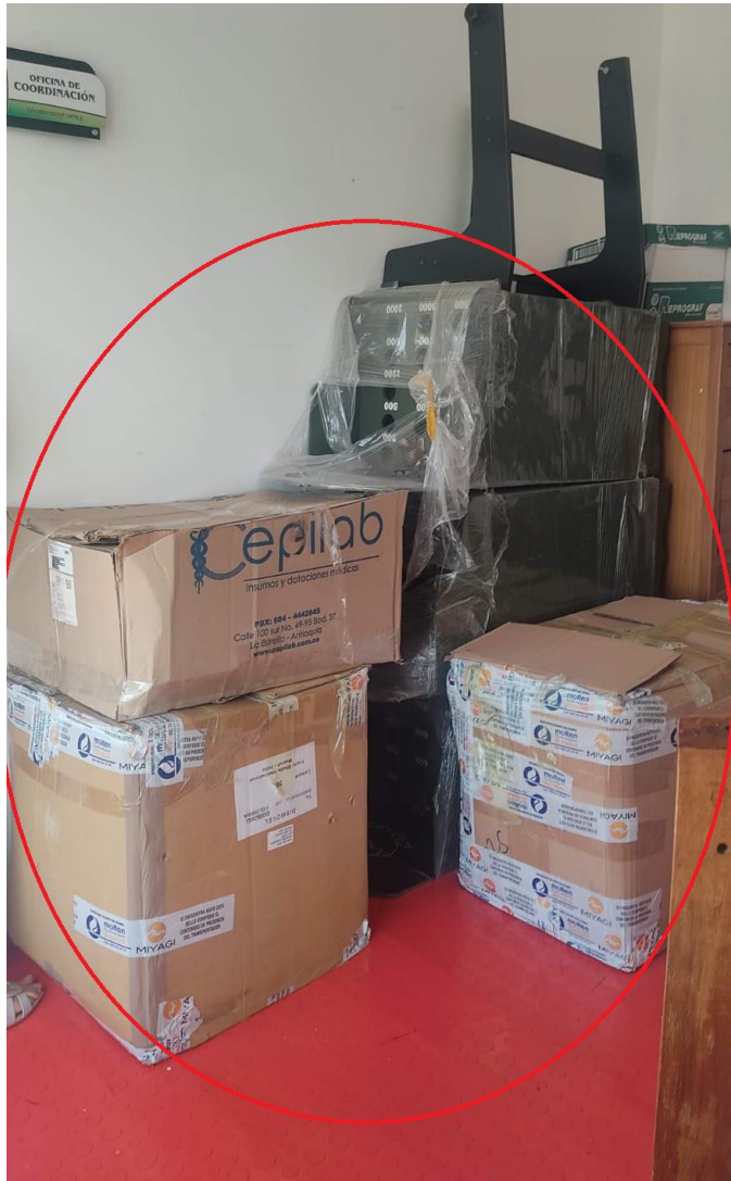
Acumulación de cajas por falta de espacio en bodegas

Unicórdoba, calidad, innovación e inclusión para la transformación del territorio.