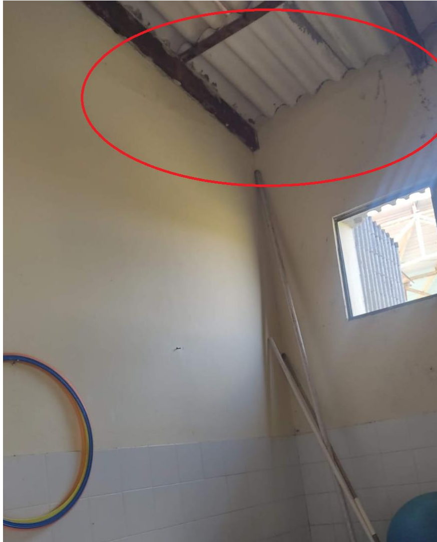
Heces fecales alrededor del techo donde se encuentra la cocina

Unicórdoba, calidad, innovación e inclusión para la transformación del territorio.