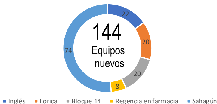
Computadores nuevos entregados por área

Del total de equipos nuevos adquiridos por la universidad, el 51% corresponde a equipos destinados para el lugar de mejoramiento Sahagún.