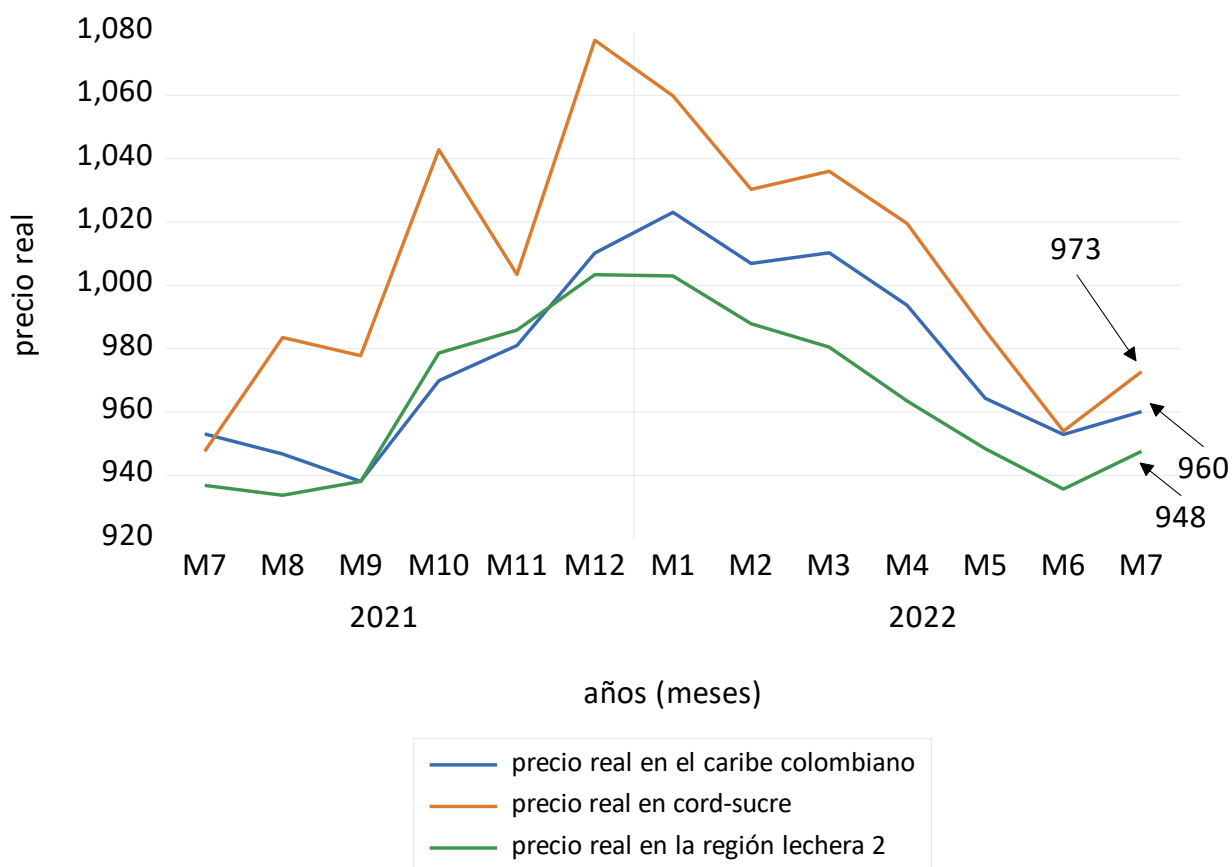
Gráfica 2. Evolución del precio real del litro de leche cruda con bonificación en Córdoba-Sucre caribe y región lechera 2, julio/2021-julio 2022, (pesos constantes de diciembre 2014)

Deflactados por el índice de precios del productor nacional de leche cruda de vaca (base diciembre 2014=100), en julio hubo un mejoramiento del precio real del litro de leche cruda con bonificación como consecuencia del aumento del precio nominal recibido por el productor y la reducción del índice de precio pagado por el productor el cual disminuyó de 185,23 a 182,58, según DANE. En Córdoba-Sucre, aumentó a $973 por litro, lo que significa que con el precio nominal actual ($1776) el productor compra bienes y servicios en su actividad por $973 del año 2014; en el caribe, $960; región lechera 2. $948, como se observa en la gráfica 2.