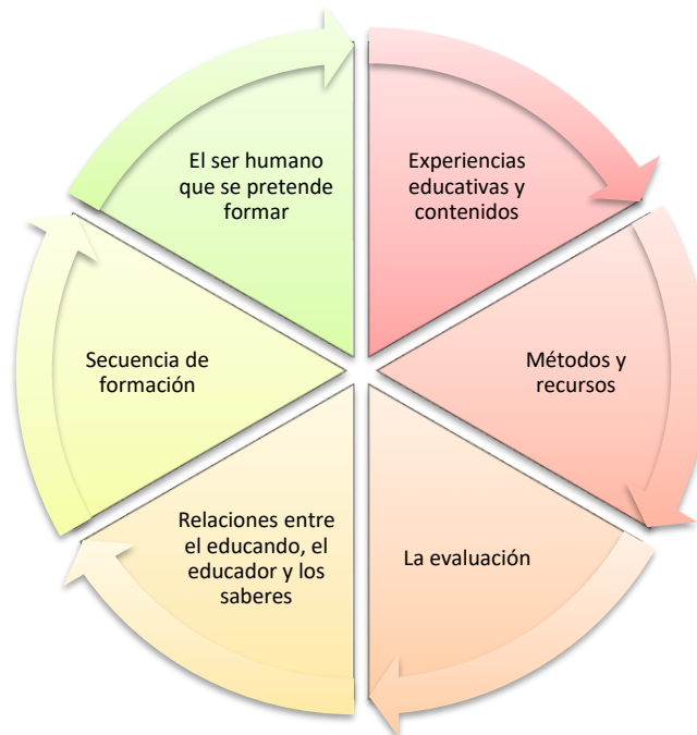
Esquema 1. Síntesis del Modelo pedagógico del programa

De igual forma, el modelo pedagógico toma posición y responde a los mismos interrogantes invariantes que se plantea el currículo. Estas respuestas constituyen los ejes esenciales de la formación de este licenciado: los propósitos; los contenidos; la secuencia; la relación entre el educador, el saber y el educando; los métodos y recursos; y la evaluación (ver representación esquemática de estos ejes esenciales)