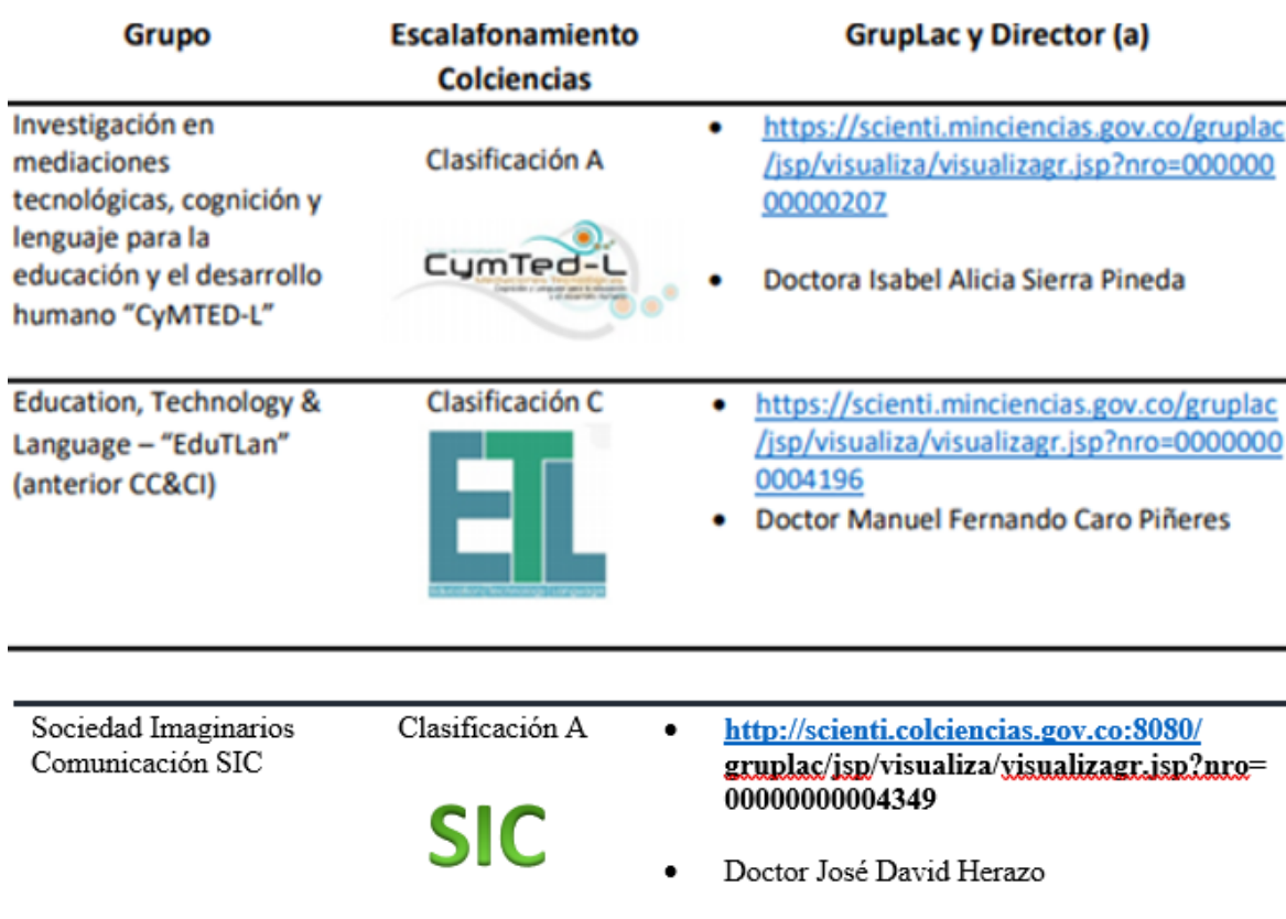
Gráfico 3. Grupos de investigación del programa

De igual forma, el programa de Licenciatura en Educación Infantil aúna esfuerzos, en pro del desarrollo de proyectos interdisciplinarios, a través de tres grupos de investigación avalados institucionalmente: