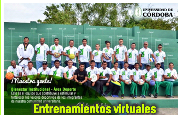
¡Nuestra gente! Bienestar Institucional - Área Deporte Este es el equipo que contribuye a estimular y fortalecer los valores deportivos de los integrantes de nuestra comunidad universitaria.

Entrenamientos virtuales Deporte Competitivo