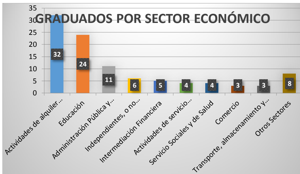
Figura 1 Vinculación por Sector Económico 2013

Como se puede observar en la tabla número 2 y en la figura 1, el 32% los graduados que cotizan al sistema de seguridad social (27,5% del total de egresados) laboran en el sector de actividades inmobiliarias de alquiler y de alquiler empresarial. De igual forma el 24% de los egresados que cotizan (20,51% del total de egresados) laboran en el sector educación.