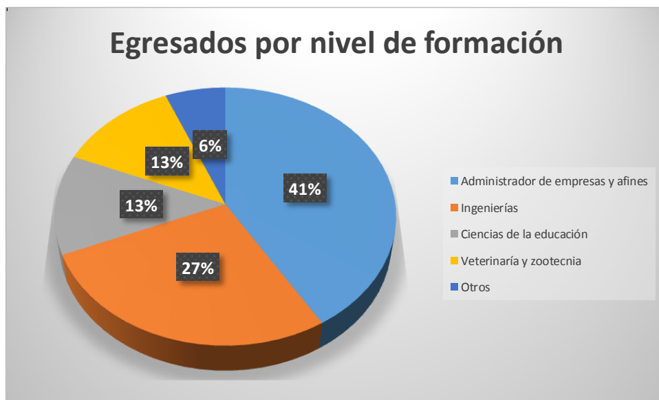
Figura 2 Egresados por nivel de formación