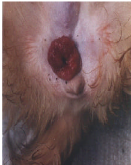
Figura 2. Neoformación de unos 3.5 cm de diámetro y de 1.0 cm por encima del nivel de la piel

signos de inflamación, desplazable; dibujamiento marcado de los vasos del lado del ganglio comprometido al ser comparado con el del lado opuesto (Figura 2). El hemograma reveló valores sanguíneos dentro de los parámetros normales.