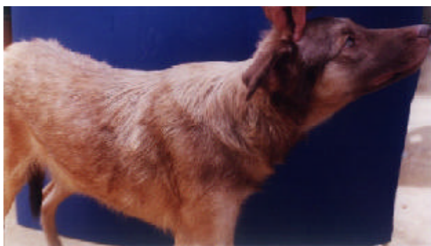
Figura 1. Hembra canina de 1.4 años de edad y de raza mestiza

En la clínica de Facultad de Medicina Veterinaria y Zootecnia de la Universidad de Córdoba - Colombia fue recibida a consulta una hembra canina mestiza, de 1.4 años de edad, de 18kg de peso (Figura 1) por presentar una neoformación en la piel a unos 2 cms de la comisura vulvar, desde hacia 25 días, de carácter creciente y que sangraba cuando contactaba superficies ásperas. Había presentado celo 4 meses antes, sin tener contacto sexual con macho alguno. Se nos informó que en la vecindad había un perro entero que sangraba por el prepucio y que frecuentaba la casa donde vivía la paciente. Como la incidencia del tumor venéreo transmisible (TVT) en la región es alta y de acuerdo con las características macroscópicas de la masa, permitió hacer la presunción diagnóstica.